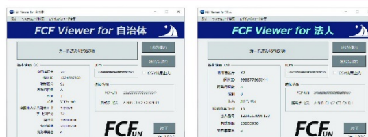
自治体版と法人版もあります